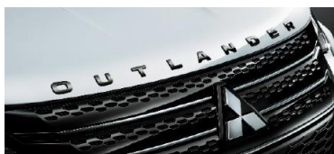
Emblem på motorhuv (svart)