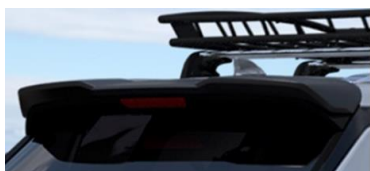
Spoiler för baklucka (Svart)