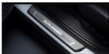
Upplyst insteg, med OUTLANDER logo