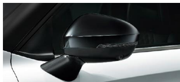
Skydd till sidospegel (svart)